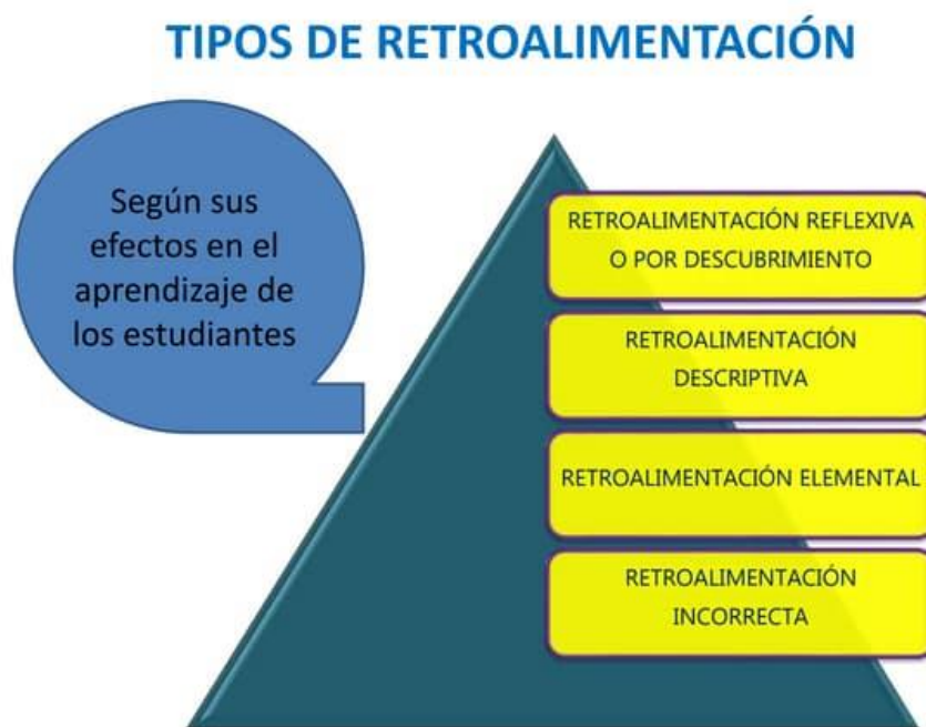
FIGURA 1: Tipos de retroalimentación